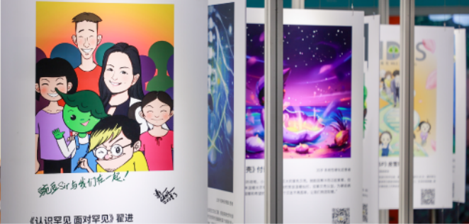
《认识罕见 面对罕见》翟进